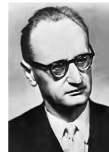
prof. PhDr. Jiří Hájek, DrSc. ministr školství (10. 11. 1965 - 7.4. 1968)