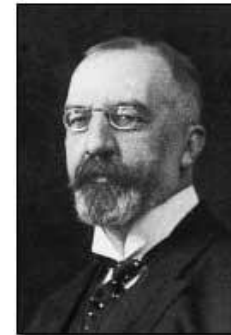
hr. Karl Stürgkh

správcem ministerstva kultu a vyučování od 15. 11. 1908 – 9. 2. 1909