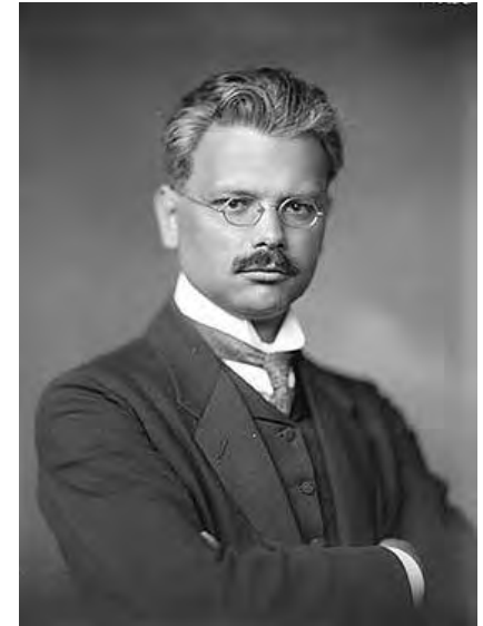
JUDr. Ivan Dérer