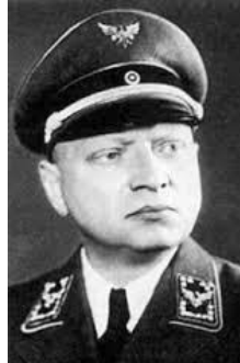
Emanuel Moravec ministr školství a lidové osvěty (19. 1. 1942 – 5. 5. 1945)