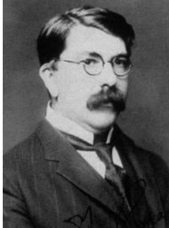
Prof. JUDr. Jan Kapras ministr školství a národní osvěty (16. 3. 1939 – 19. 1. 1942)